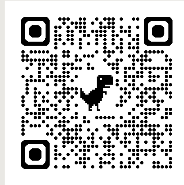
Guía de vivienda para nuevos estudiantes